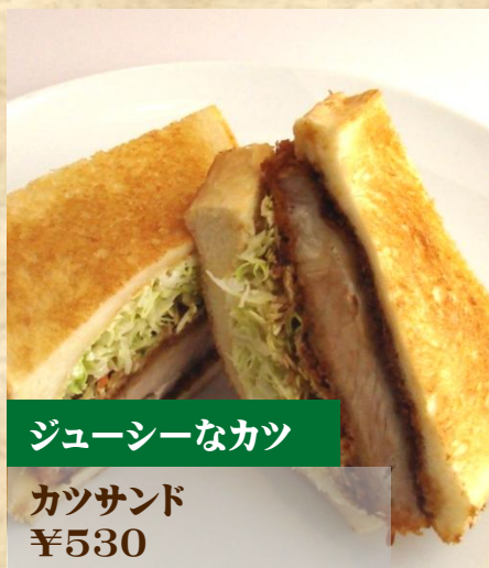
ジューシーなカツ