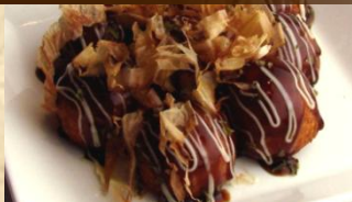
ふわっとろな食感